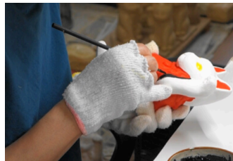
塗りは全て肉筆手彩色